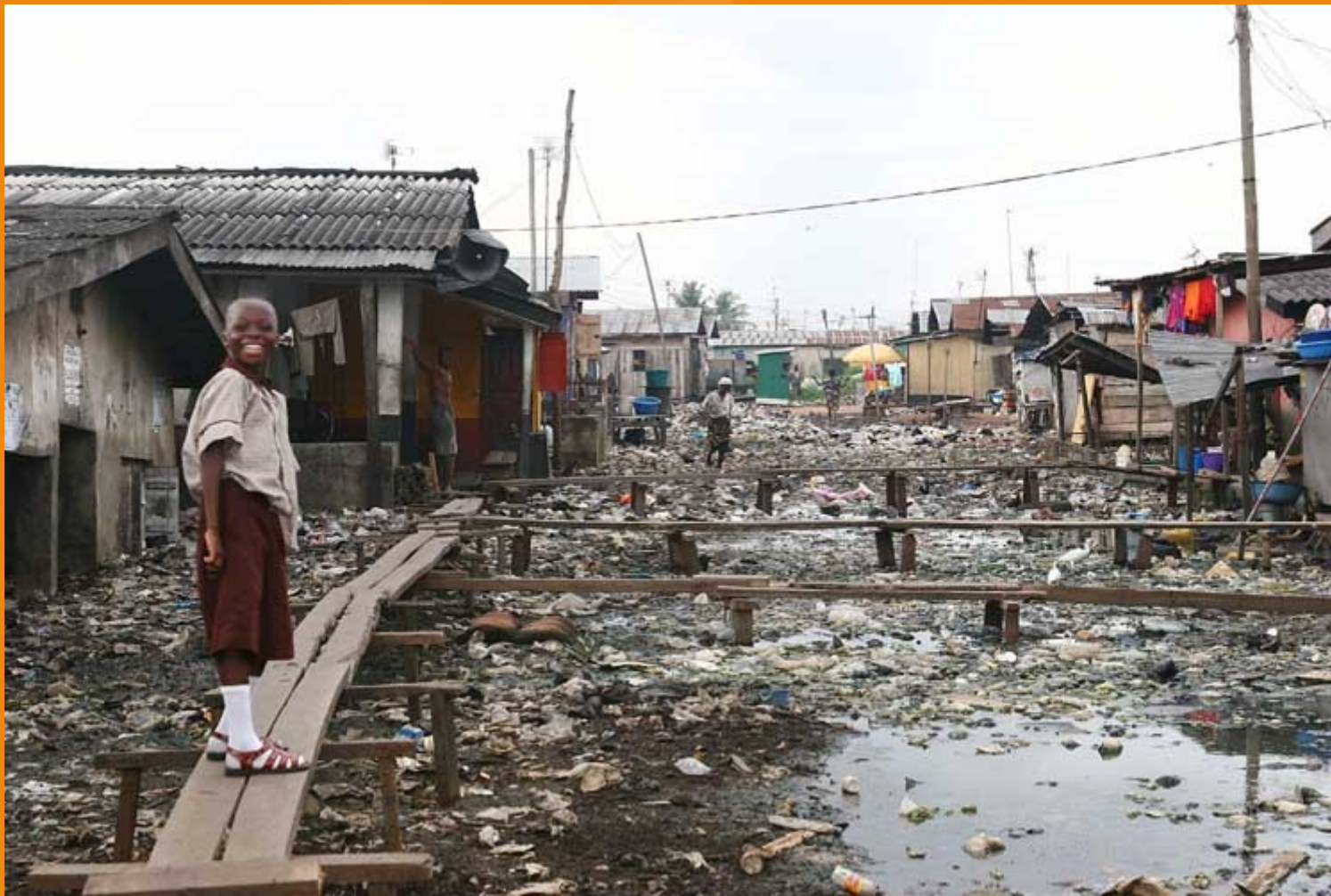
• Lagos (Niger)