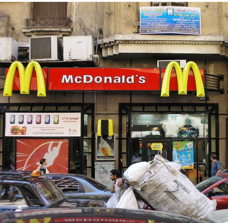
Egypt, obr. 17