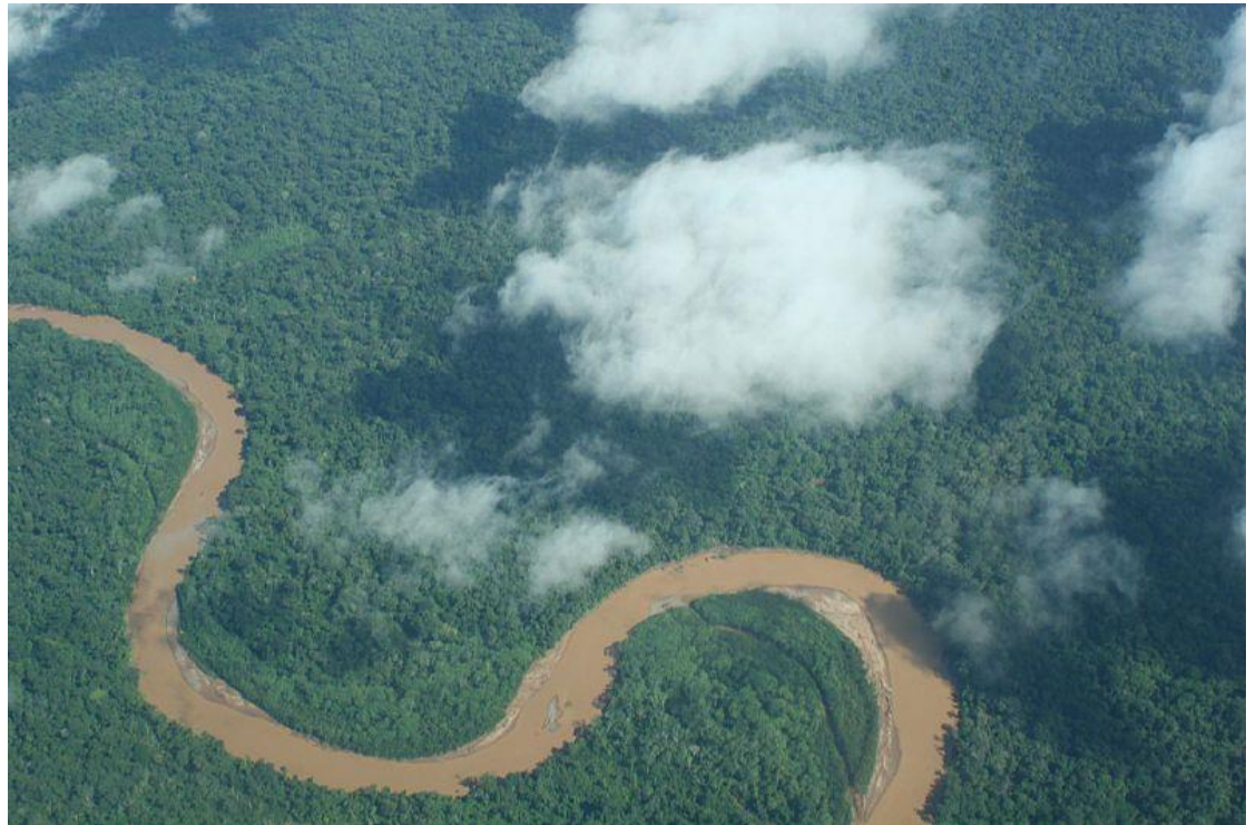
Amazonie, obr. 1