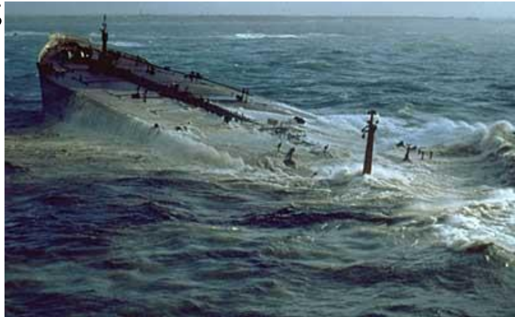
Ropná skvrna po havárii tankeru, obr. 23