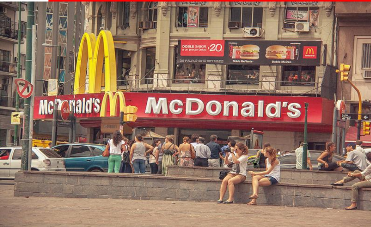
Buenos Aires, obr. 15